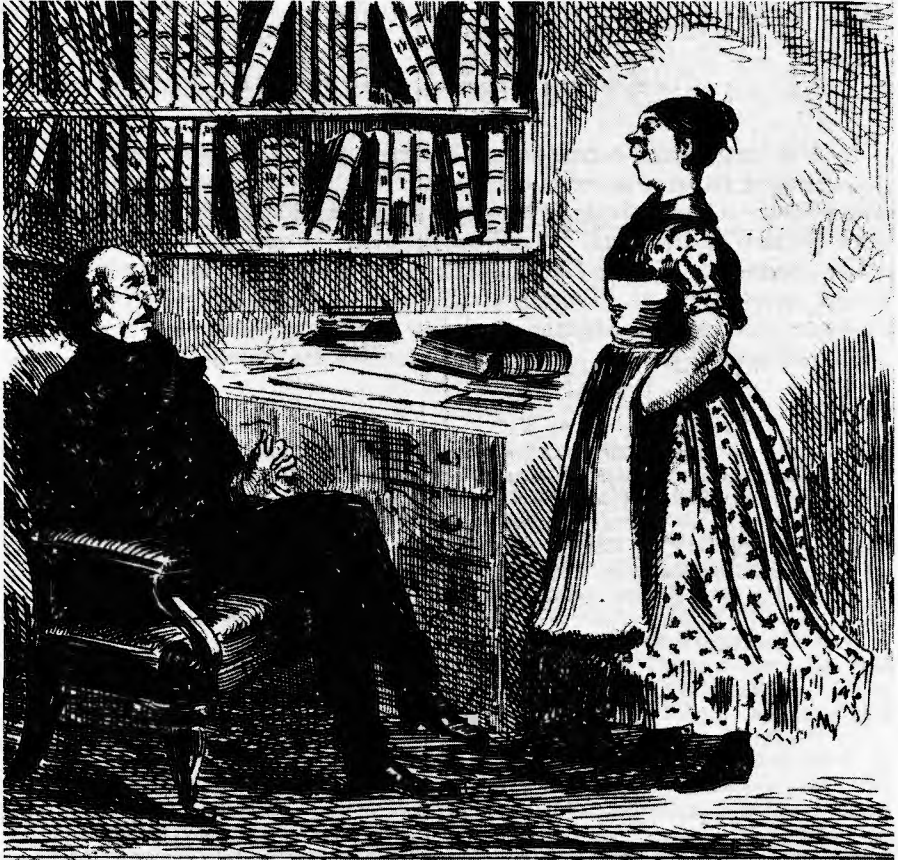
Illustration 1. — LE RECENSEMENT DES DOMESTIQUES EN 1871.

OLD REGULUS. —“ It is necessary, Bridget, that you should inform me of your age and origin that I may comply with the law in filling up the census.